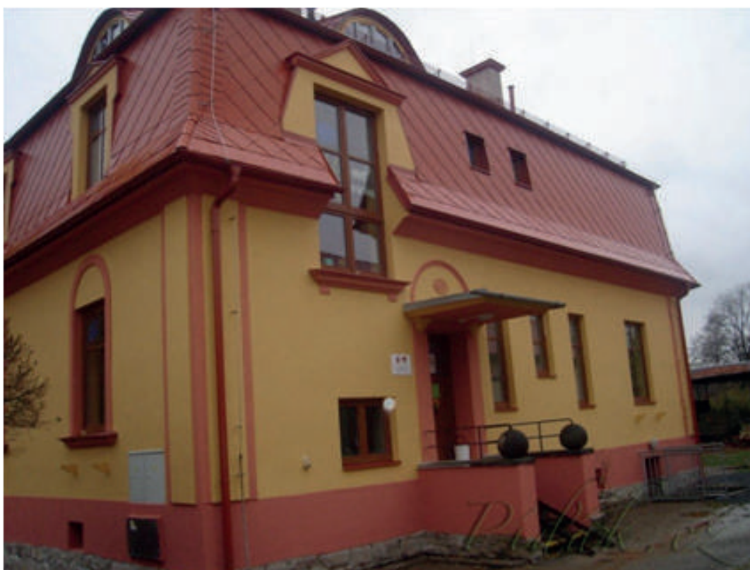
Budova Rodinného centra Víkýrek