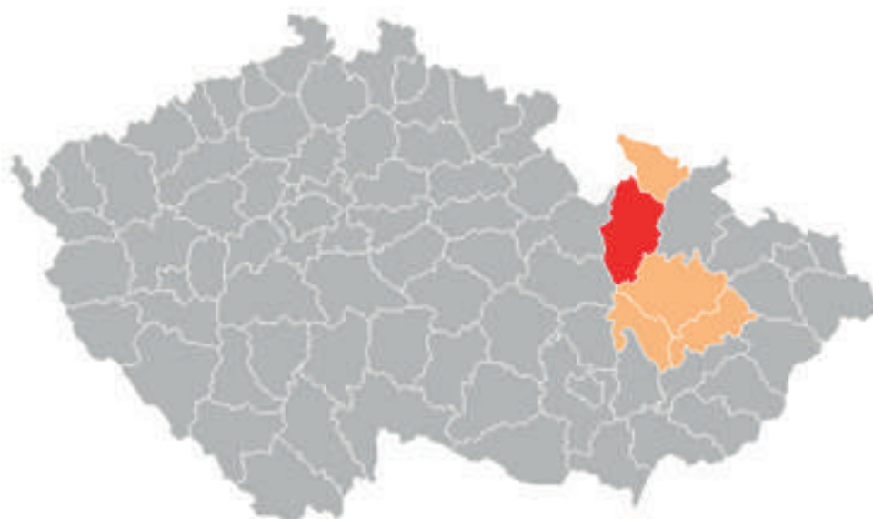
Zanesení zmiňovaných regionů na mapě ČR

Naše lokalita je typická tím, že jsme pohraniční oblast, relativně vzdálená od velkého města. Je zde také nadprůměrná nezaměstnanost, nedostatek kvalitních pracovních příležitostí, nižší hustota osídlení, nedostatek zdravotnických zařízení či nedostatek sociálních služeb, tudíž i nedostatek organizací zaměřujících se na pomoc rodinám.